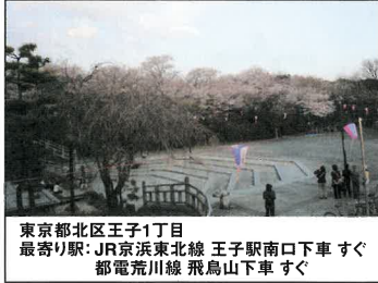
東京都北区王子1丁目 最寄り駅: JR京浜東北線 王子駅南口下車 すぐ 都電荒川線 飛鳥山下車 すぐ